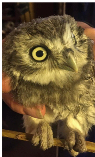
Jeune chouette chevêche 2022