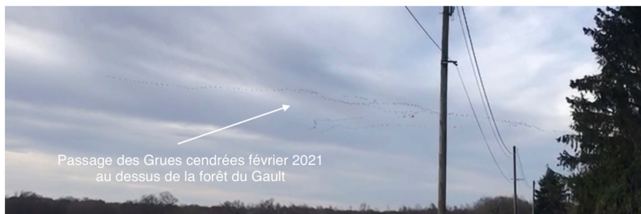
Avifaune observée par les habitants chaque années