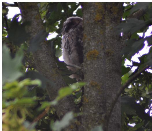
Jeune chouette Hulotte 2022